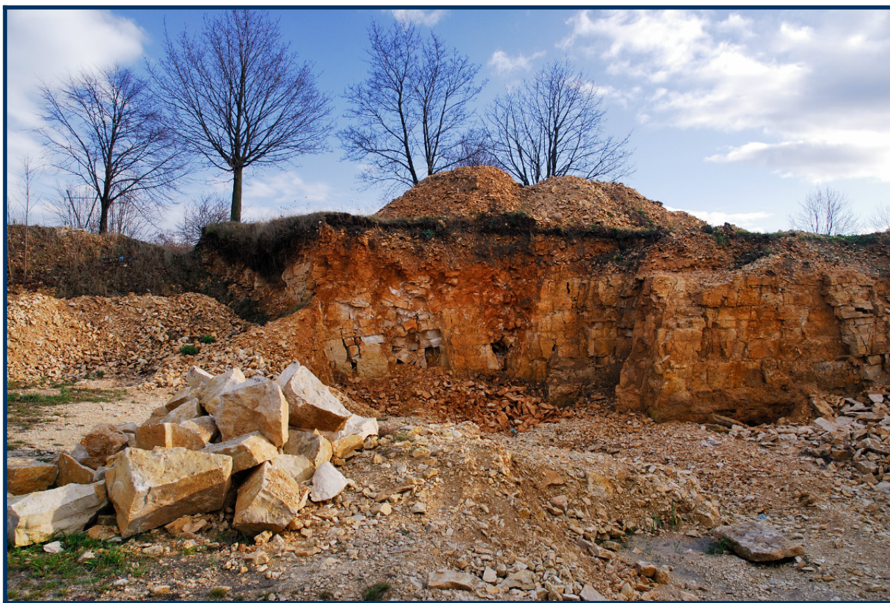
Kamieniołom na wzgórzu chorońskim