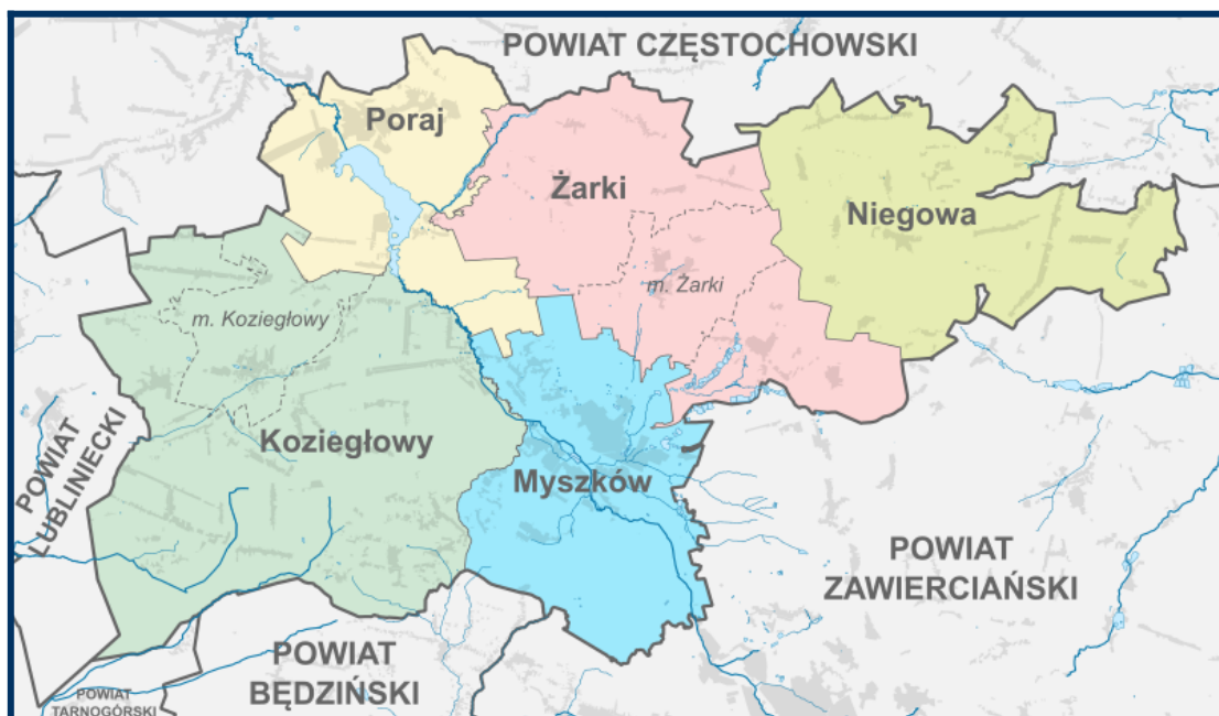
Mapa administracyjna powiatu myszkowskiego