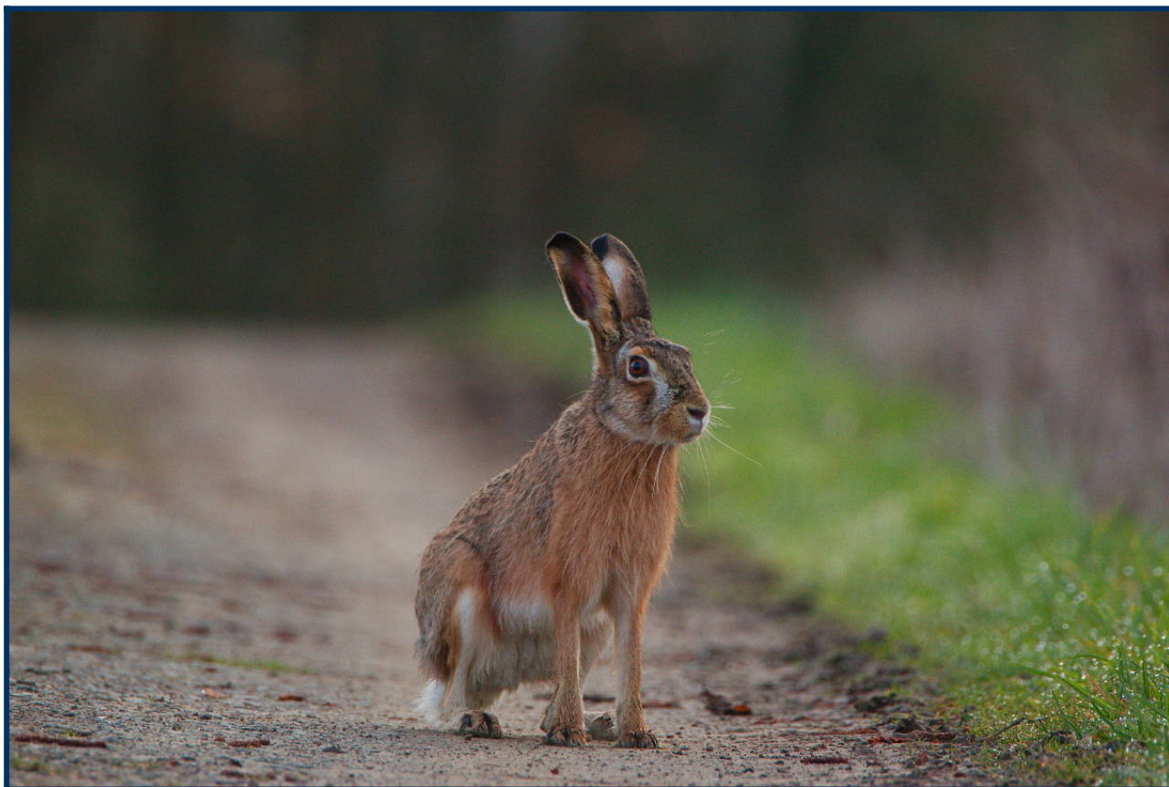
Zając szarak

terenów otwartych to myszy polne ( Apodemus agrarius ) i polniki ( Microtus arvalis ) wyrządzające niekiedy szkody w uprawach.